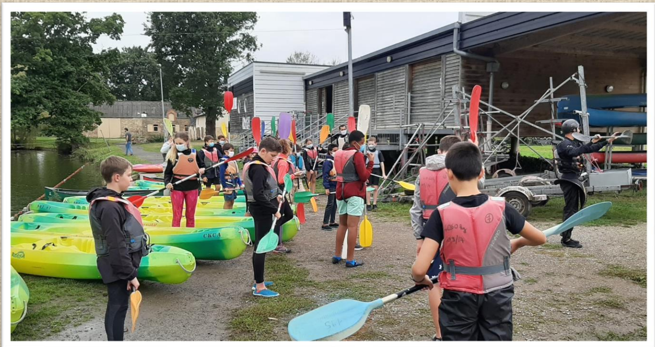
Quelques conseils pour diriger son embarcation