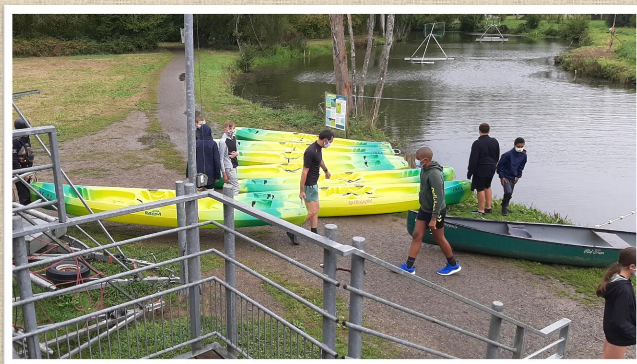
La sortie des embarcations