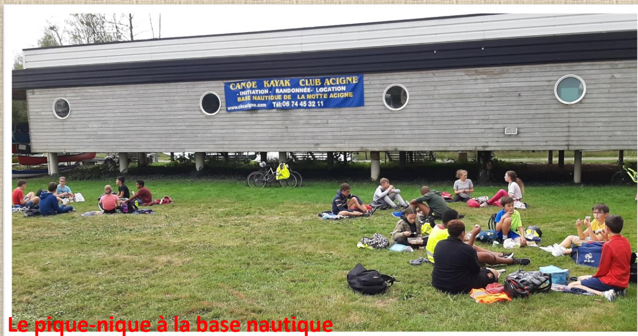
Le pique-nique à la base nautique

21 élèves ont fait le déplacement groupé, à vélo, du collège à la base nautique d'Acigné pour passer un agréable après-midi sur l'eau de la Vilaine.